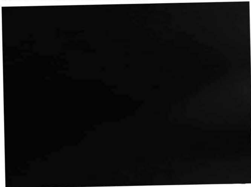
Reunião Comissão de Revisão de Prontuários