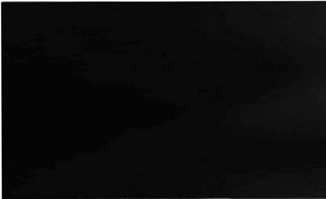
Capacitação comportamental dia 04/04